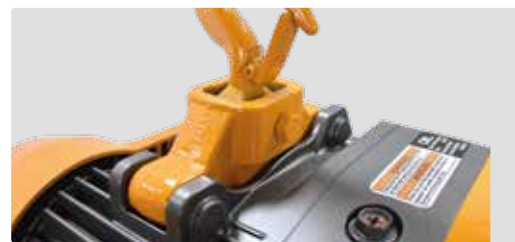
Optional mit Oberhaken